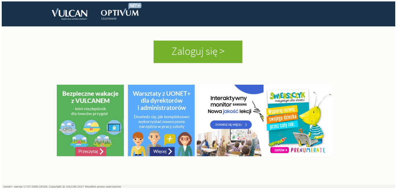
Rysunek 1. Strona główna systemu UONET+ przed logowaniem

Uruchom stronę https://uonetplus.vulcan.net.pl/pulawy , a następnie kliknij przycisk Zaloguj się