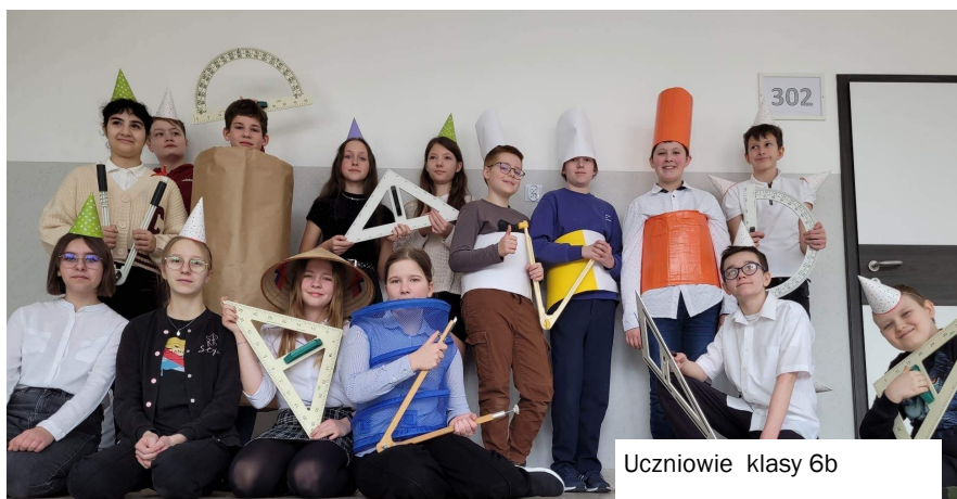
Uczniowie klasy 6b

5. 8 marca - Dzień Kobiet - świętowały wszystkie dziewczyny i panie.